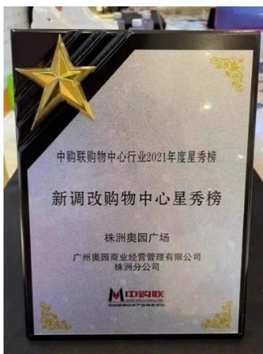
株洲奧園廣場榮登 「新調改購物中心星秀榜」