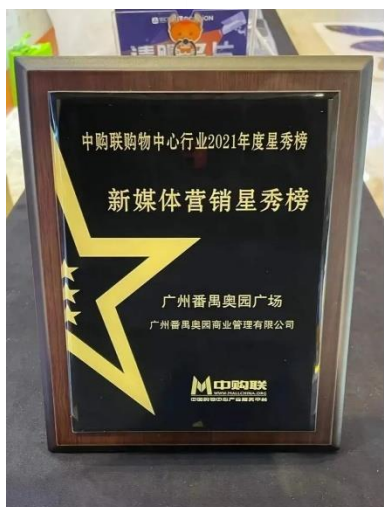
廣州番禺奧園廣場榮登 「新媒體行銷星秀榜」