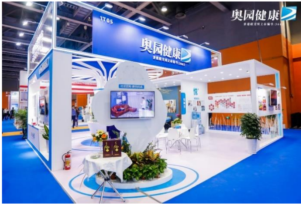
「健康生活服務站」亮相 2021 廣州物博會