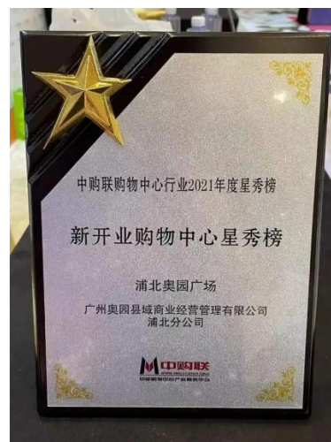
浦北奧園廣場榮登 「新開業購物中心星秀榜」