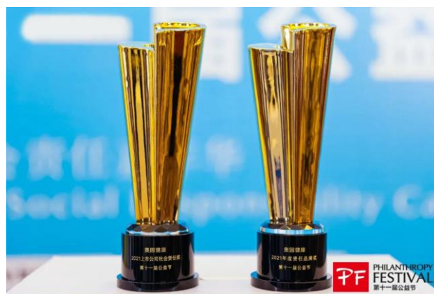
奧園健康榮獲「2021 年度責任品牌獎」及「2021 上市公司社會責任獎」雙料大獎

奧園健康在實現企業可持續發展的同時，履行各項企業社會責任，多年來積極貫徹黨中央精準扶貧和鄉村振興戰略部署，堅持以黨建引領為導向，並發動社區、商圈力量持續開展慈善公益活動。同時，還在廣東五華、蕉嶺、貴州威寧等多個地區運營大型縣域商業綜合體，大力推行奧園鄉村振興模式，助力鞏固脫貧攻堅成果和鄉村振興事業發展。