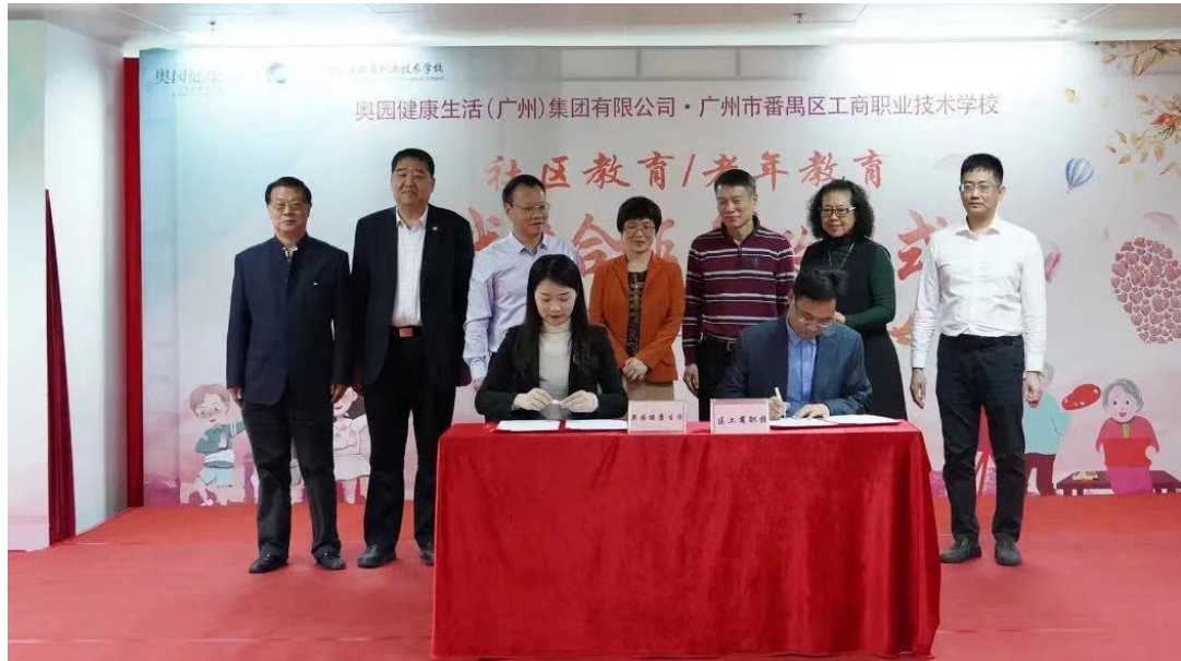
雙方在現場進行合作簽約