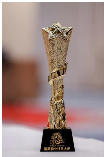
「最美物業扶貧大使」