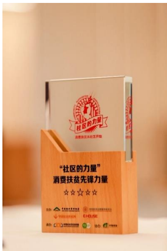
「社區的力量消費扶貧先鋒力量專項行動 TOP50」

12 月 12 日，由中國扶貧志願服務促進會、中國物業管理協會指導，中國社區扶貧聯盟主辦的中國社區扶貧聯盟第三屆理事大會在上海順利召開。大會上，奧園健康憑藉積極的扶貧行動榮獲「社區的力量消費扶貧先鋒力量專項行動 TOP50」、「最美物業扶貧大使」、「中國扶貧聯盟理事大會新晉理事單位」、「藏區青苗牽手計劃青稞認購證書」多項榮譽。