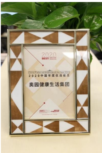
智聯招聘頒發的「2020 中國年度優選僱主」