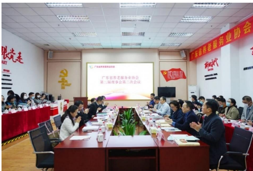
廣東省養老服務業協會第二屆理事會第二次會議召開

精神，倡議搭建省內醫養結合溝通協作平台，加強資訊溝通，結合康養服務體系研究和人才培訓，為老人提供安全、規範、優質的醫療衛生服務，切實提升老年人的獲得感和滿意度。