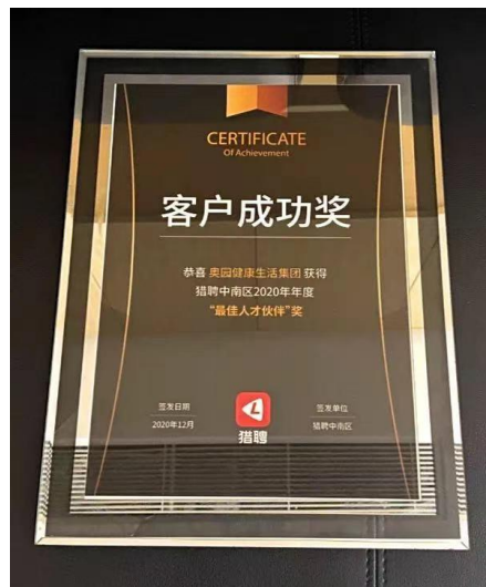
獵聘頒發的 2020 年度客戶成功獎之 「最佳人才夥伴」獎