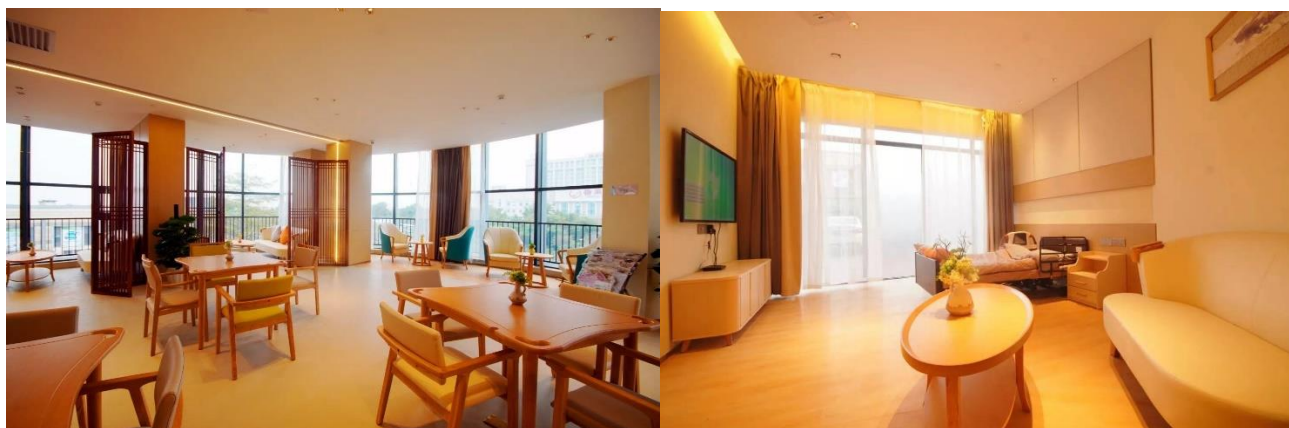
奧園健康幸薈裡頤康中心環境