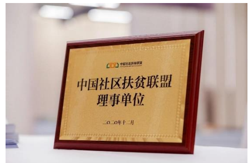
「中國扶貧聯盟理事大會新晉理事單位」