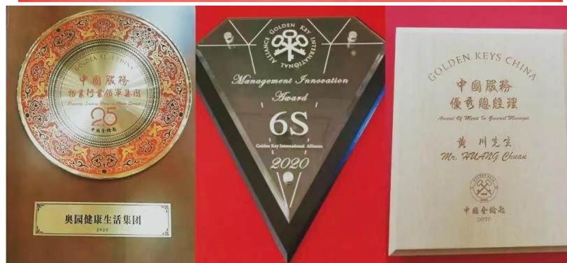
奧園健康攬獲金鑰匙國際聯盟頒發多項殊榮