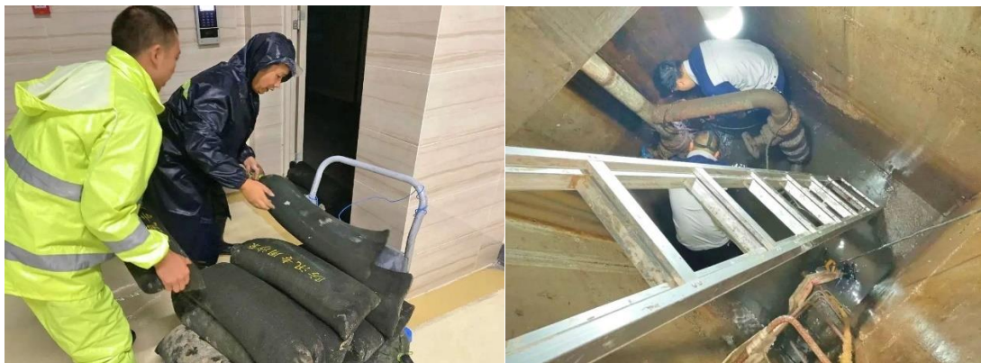
圖左：半小時接力搬運防洪沙袋到車庫低窪地帶，築起阻擋洪水的安全牆

不久前，四川發布近 7 年來首個暴雨橙色預警.....收到預警半個鐘頭內，成華奧園廣場和廣漢玖瑰灣項目物業人員立即啟動應急預案，迅速組織各部門員工全力開展防汛搶險各項工作。