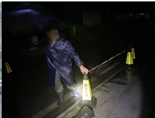
圖左：廣漢玖珑灣物業服務人員在逐漸加大的雨勢中給低窪地拉隔離帶