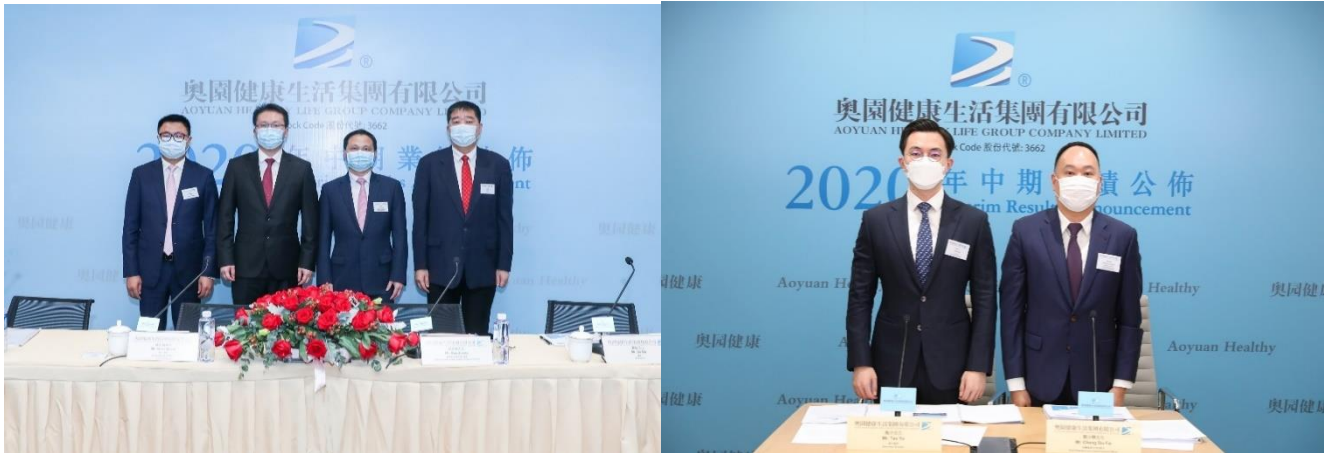
奧園健康管理層分別在廣州總部和香港辦公室參與會議